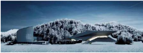
Erl Winter Festival Hall, Trol, Oostenrijk 2007