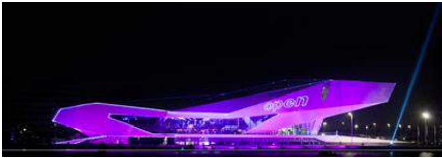
Saskia Paërl ODMDT1