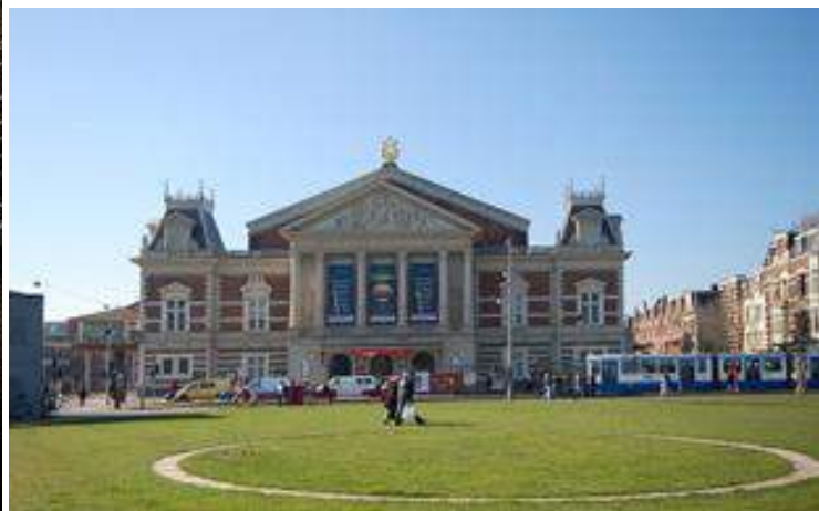
Het Concertgebouw met de aanbouw( 1988)