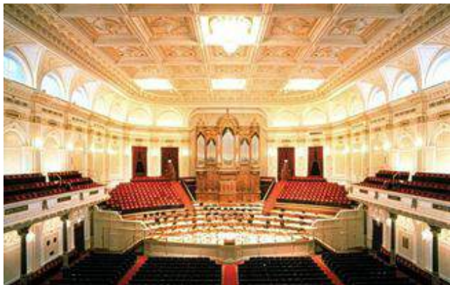
1987 grote zaal