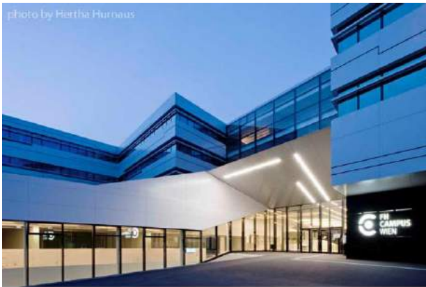
Haus Ray 1 - Delugan Meissl's eigen huis, Wenen 1998