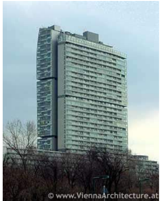
De Mischektoren uit 2000 (foto rechts)

Beide gebouwen staan in Donau-City, Wenen. Het zijn de eerste gebouwen die zij samen hebben ontwikkeld.