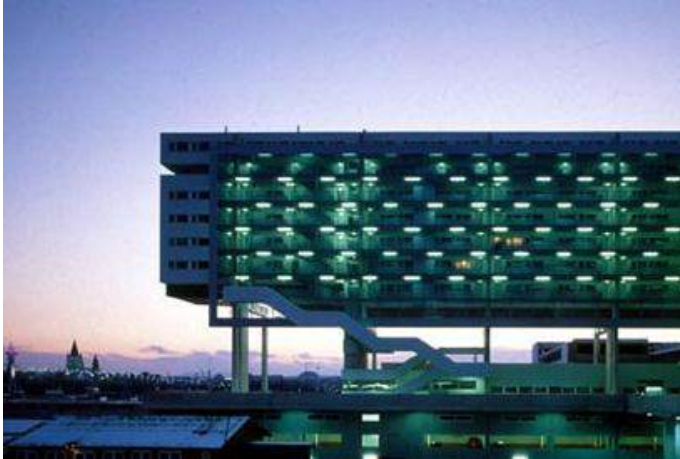
De Beam apartments uit 1998 (foto links)

Sinds 1998 ontwerpen architect Roman Delugan en zijn vrouw Elke Delugan-Meissl gebouwen met een eigen visie.